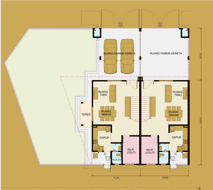
PELAN LANTAI TINGKAT BAWAH