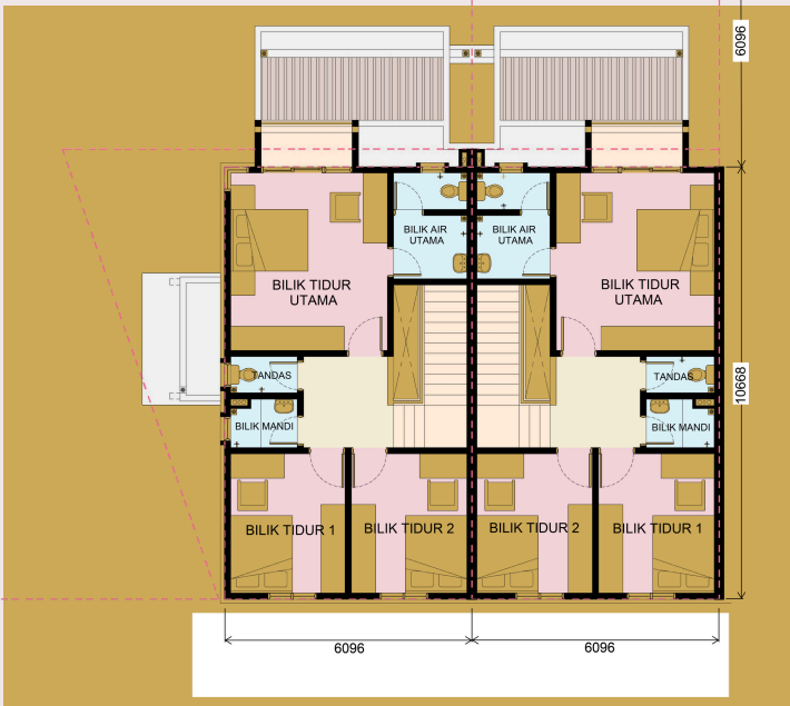
PELAN LANTAI TINGKAT SATU